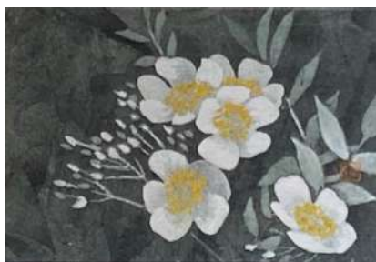
24. ノバラ (ハガキ)