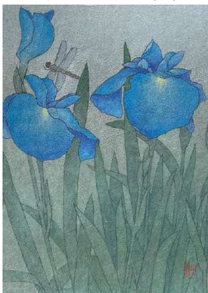
50. ハナショウブ (F4)