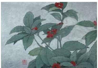
13. センリョウ (SM)