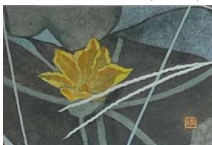
87. カボチャの花 (ハガキ)