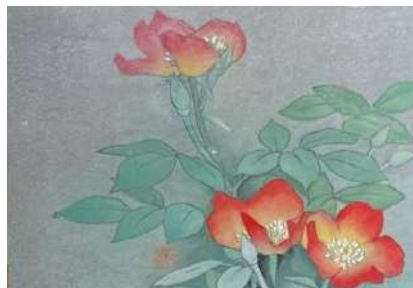
12. バラ赤 (SM)