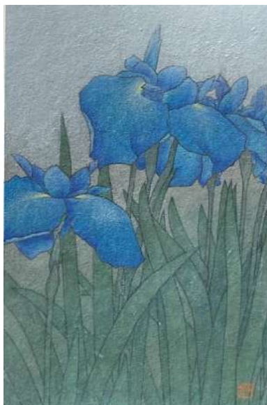
40. ハナショウブ (P4)