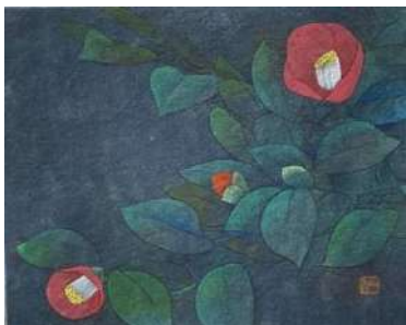
34. ツバキ (F3)