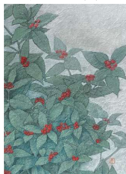
54. センリョウ (F4)