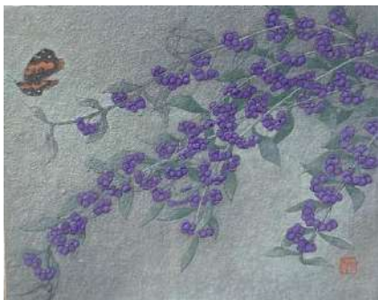
3. コムラサキシキブ (F3)