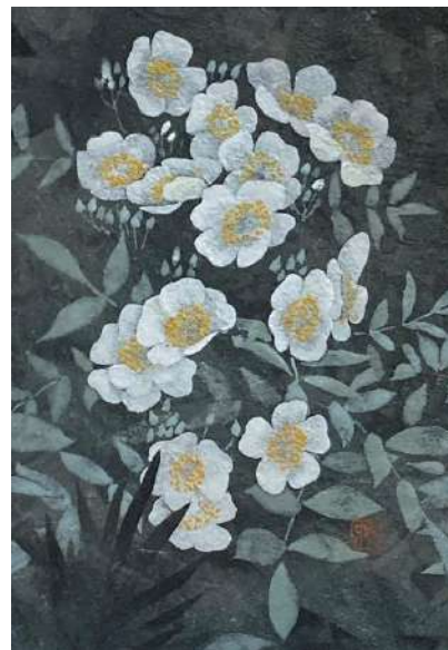
14. ノバラ (SM)