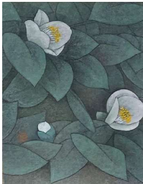
68. 白ツバキ (F0)