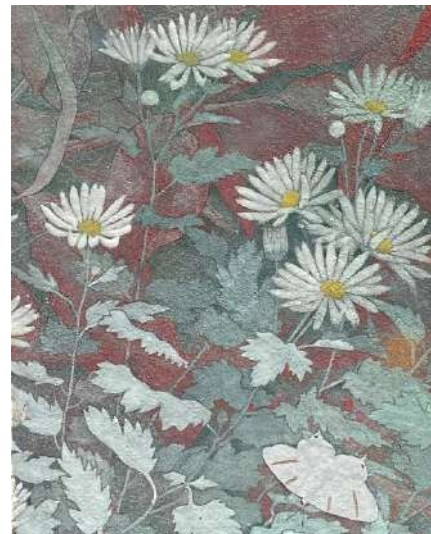
106. キクと蛾 (F3)