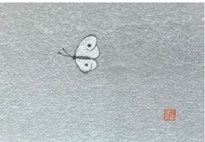
22. モンシロチョウ (ハガキ)