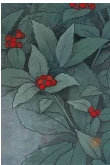
25. センリョウ (ハガキ)