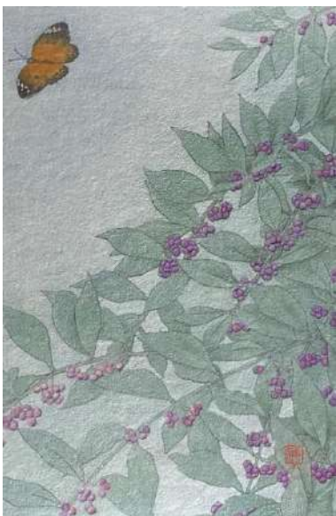
39. コムラサキシキブ (P4)