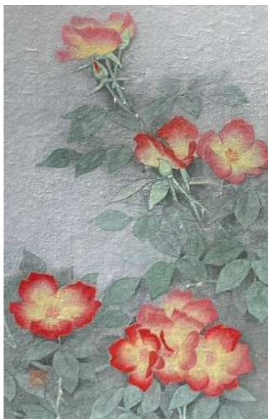
44. バラ赤 (P4)