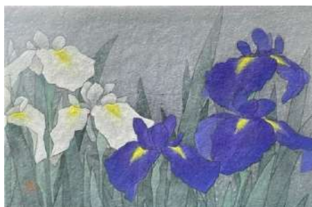
37. ハナショウブ (P4)