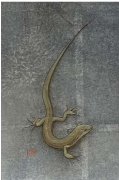
72. トカゲ (P0)