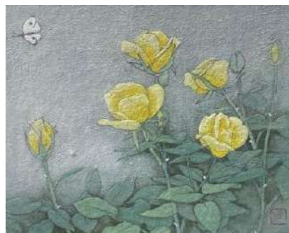
5. バラ黄 (F3)