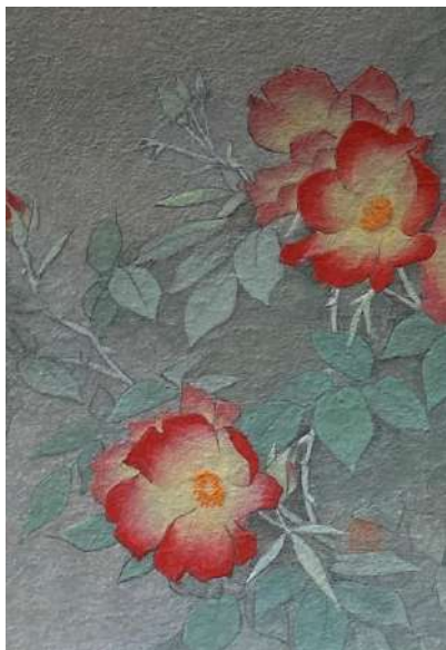
9. カクテル? (SM)