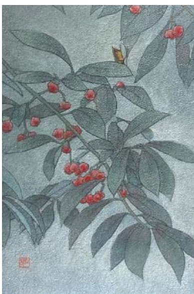
45. マユミ (P4)