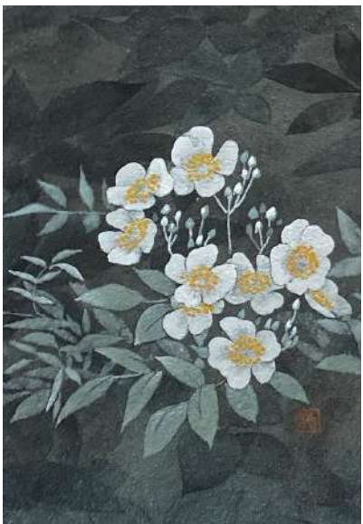
15. ノバラ (SM)