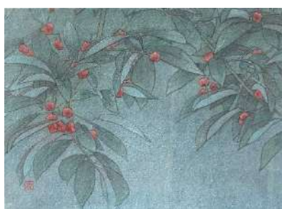
48. マユミ (F4)