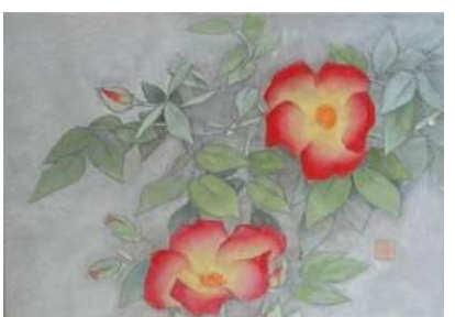
10. バラ赤 (SM)