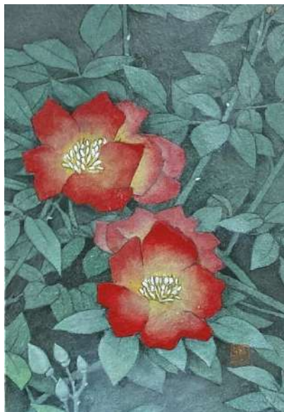
11. バラ赤 (SM)