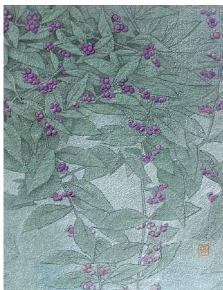
36. コムラサキシキブ (F3)