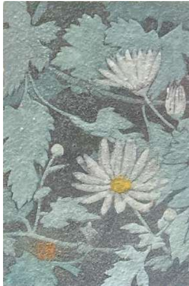
114. キク (ハガキ)