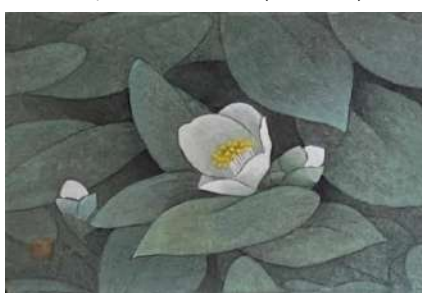
89. 白ツバキ (ハガキ)