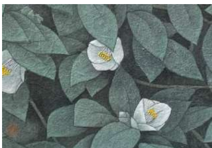
7. ツバキ白 (SM)