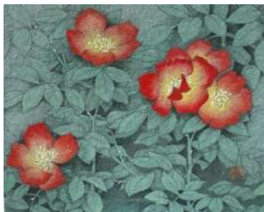
35. バラ赤 (F3)