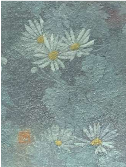
112. キク (F0)