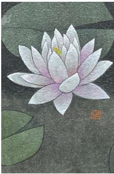
66. スイレン (ハガキ)