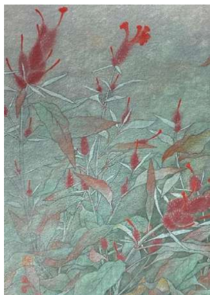
46. ケイトウ (F4)