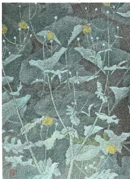
47. 叢 (F4)