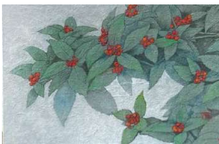
42. センリョウ (P4)