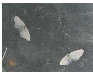
84. 蛾2匹 (F0)