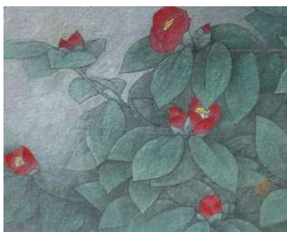
4. ツバキ赤 (F3)