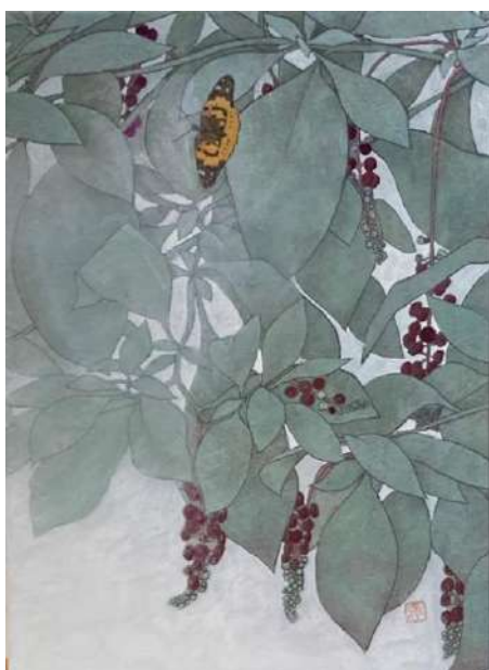
55. ヤマゴボウ (F4)