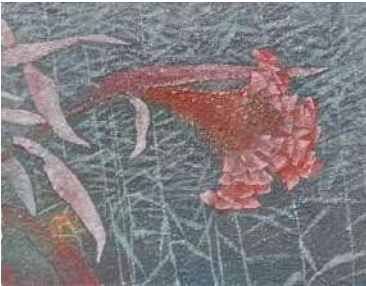
113. ケイトウ (F0)